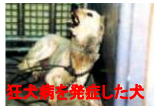
狂犬病を発症した犬